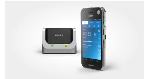
SpeechAir smartes Diktiergerät