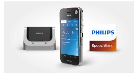
SpeechAir smartes Diktiergerät Workflow-Software SpeechExec Pro Dictate