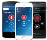
Philips Voice Recorder App